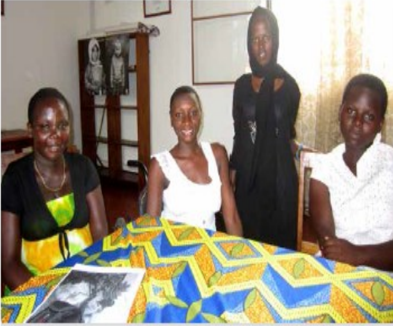
مناقشات جماعية مع فتيات مرهقات من ذوات الإعاقة - بوروندي

بالرغم من كون الأنماط الجنسانية لا تقتصر على البيئات الإنسانية، فإنه يمكنها أن تزيد من مخاطر تعرض النساء والفتيات ذوات الإعاقة لعنف العشير، في حال كن غير قادرات على تلبية توقعات شركائهن الذكور كزوجات وأمهات مناسبات، مما قد يؤدي إلى تفاقم اختلال موازين القوى في هذه العلاقات، وزيادة قابلية تعرضهن للعنف الجنسي. مع العلم بأن الرجال المعوقين وغير المعوقين على حد سواء تكون لديهم حوافز ضعيفة للاضطلاع بأدوار أخرى كرعاية الأطفال، كون ذلك من الأمور المستخف بها في المجتمع ويقال على نحو أكبر من وضعهم بين الرجال. كما يساهم التفاعل المعقد بين المعايير المجتمعية والتوقعات المفروضة على كل من النساء والرجال، إلى جانب الفشل المتصور بخصوص النساء ذوات الإعاقة في القيام بالأدوار المتوقعة منهن داخل الأسرة، في تعريضهن لخطر العنف الجسدي بصورة أكبر من جانب شركائهن الذكور.