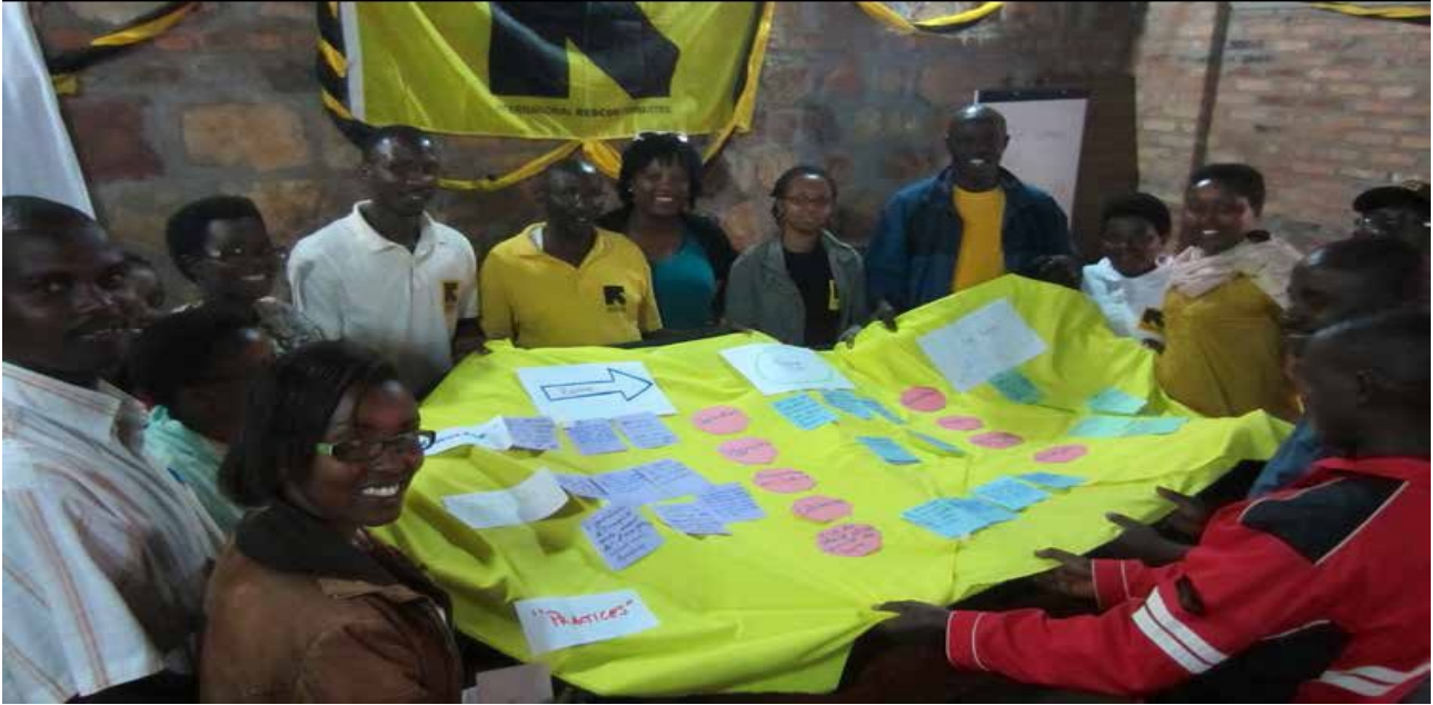
نشاط تشاركي مع الممارسين في برامج مكافحة العنف الجنساني - بوروندي

تم اختيار نهج تشاركي من أجل إشراك أصحاب المصلحة والمستفيدين في عملية التقييم كشركاء، ليس فقط في تحصيل البيانات بل وفي تحديد نوع التغيير الذي يحدث فارقاً جوهرياً. كان اختيار النهج التشاركية من