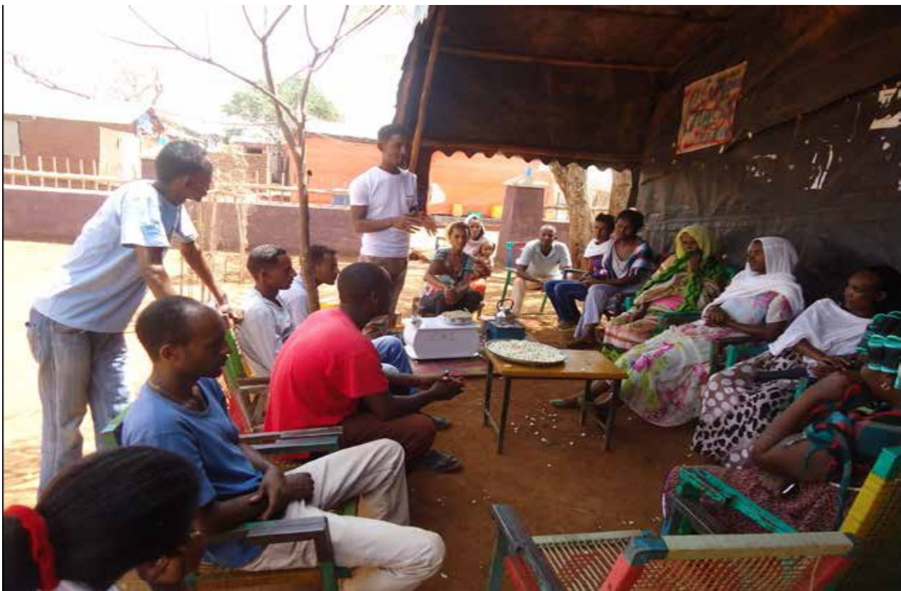
جلسة حوار، مخيم ماي عيني للاجئين، أثيوبيا

إقامة فعاليات اجتماعية تضم فتيات صحيحات وأخريات ذوات إعاقة لتعزيز شبكات الأقران.