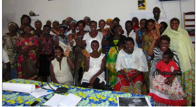
ورشة عمل لأصحاب المصلحة في بوروندي

لكونهم من بين أكثر فئات السكان الأكثر عرضة للمخاطر أثناء الأزمات. فالمناصرة المستمرة على الصعيدين الدولي والوطني ضرورية لتشجيع الحكومات على توقيع وإقرار جميع المعاهدات ذات الصلة، ولتحميل جميع الجهات المانحة ذات الصلة المسؤولية تجاه تنفيذ الاتفاقيات الجديدة والقائمة، بما في ذلك اتفاقية حقوق الأشخاص ذوي الإعاقة، واتفاقية القضاء على جميع أشكال التمييز ضد المرأة والقرارات الصادرة عن مجلس الأمن بشأن المرأة والسلام والأمن.